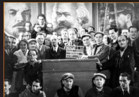
Photo de tournage de LA VIE EST À NOUS, avec au 1er plan divers dirigeants du PCF: Marcel Cachin, Jacques Duclos, Maurice Thorez et, juste derrière, Jean Renoir