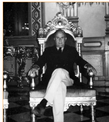
Une fête donnée en l'honneur de Jean Rouch au Centre National de la Recherche Scientifique, Paris, 1987.