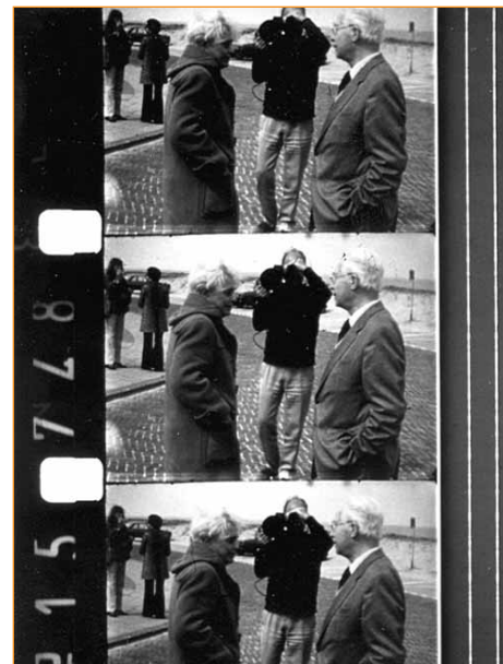
Photogramme de CINÉ-MAFIA

Puis il est devenu le Président de l'association Les amis de Joris Ivens que nous avons créée en 1990. Il était toujours présent à la projection que nous organisons chaque année à la mémoire de Joris, toujours présent avec la gentillesse, l'humour, la joie de vivre qu'il avait su conserver malgré les peines et les chagrins de la vie.