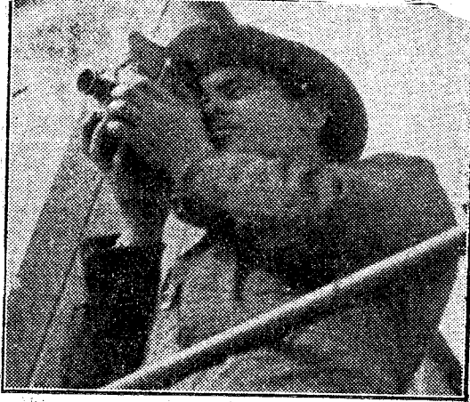
Joris Ivens werkt.

nog een film gemaakt, die vijf acten lang is, uitvoeriger beelden geeft van het geweldige werk, daardoor niet zóó sterk van conceptie vermocht te zijn, als het kortere slot van „Wij bouwen”. Ivens loopt vaak kans zich in het detail te verliezen, maar daar het nimmer stoort, doet het aan het geheele werk weinig af. Men behoeft ook niet te verwachten, dat al het werk zoo zuiver zal zijn als „Heien”.